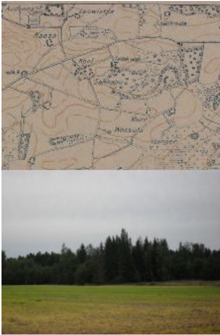
Tellisevabriku oletatav asukoht: